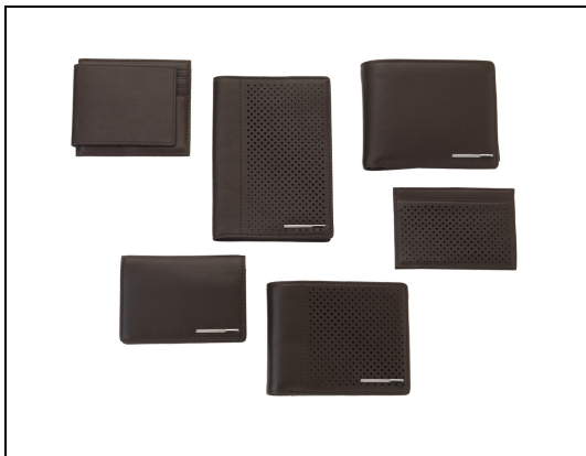
Small Leather Goods 系列

一如以往，Links of London 提供的刻字服务，适用于大部份礼品，可让你的礼品添上个人化讯息(详情请向店员查询)；而所有礼品都经 Links of London 店员细心包装，并饰以漂亮蝴蝶结，无论送礼者与收礼者，都在这圣诞佳节充满兴奋与欢乐！