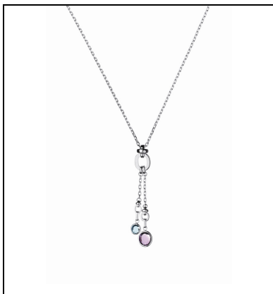
Brit Lines 项链

献给她的精选礼品：最新黄金及玫瑰金 20/20 系列及以香槟泡沫为创作灵感的 Effervescence 系列，将会是一个不错的选择- 20/20 系列标志着品牌创立 20 周年，其三环设计亦反映着品牌哲学” Love, London, Life”；Effervescence 系列，其设计让人想起好友相聚的快乐时刻，亦反映出品牌跳脱及充满创意的一面；至於全新 Brit Lines 系列，是原有的 Brit Lines 系列的变奏，以纯银结合宝石为设计，洋溢清新伦敦气息；至於典雅的 Allegra 腕表系列及全新的紫色皮具系列，充分展现女性的妩媚与独特品味。