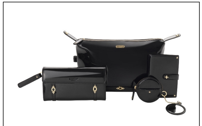
Small Leather Goods 系列